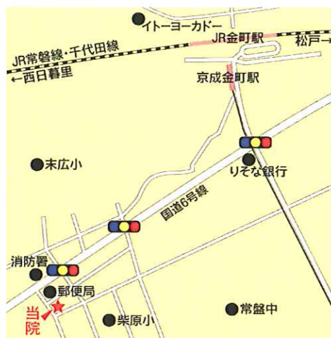
JR 常磐線/千代田線 金町駅 京成線 京成金町駅 徒歩 12分

「脳死は人の死」とする臓器移植法の改正案が可決された。臓器提供を持つ家族は胸をなでおろす一方、脳死や脳死に近い状態が続く子どもの家族らは肩を落とした。幼児救急の救命率が先進国で最悪といわれるわが国の小児救急医療のもとで、短い時間に判断し実行されなければならない移植医療の体制は整っているのか。脳死判定をきちんとできる医師はいるのか、臓器が提供可能かを検査できるスタッフはそろっているのか、そして子どもの終末期医療や家族へのケアは…。 H. N.